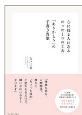
心に残る人になる たった1つの工夫「ありがとう」の 手書き習慣