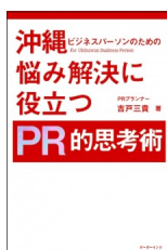
沖縄ビジネスパーソンのための 悩み解決に役立つPR的思考術