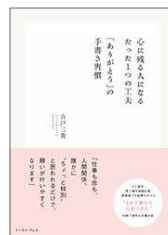
心に残る人になる たった1つの工夫「ありがとう」の 手書き習慣