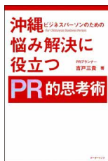
沖縄ビジネスパーソンのための 悩み解決に役立つPR的思考術