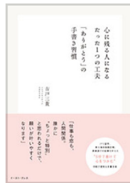
心に残る人になる たった1つの工夫「ありがとう」の 手書き習慣